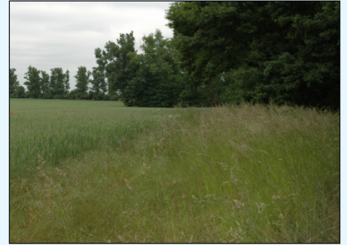
Abb.1: Feldrand eines Weizenschlages in Ketzin mit verschiedenen Wildgrasarten

Wildgräser können in der Epidemiologie von viralen Krankheitserregern als „Grüne Brücke“ eine besondere Stellung einnehmen. Im Getreideanbau gehört das durch Blattläuse übertragende Barley Yellow Dwarf Virus zu den wirtschaftlich bedeutendsten Virose. Das weite Wirtspflanzenspektrum in der Familie der Poaceae und die enge räumliche Vergesellschaftung von Wildgras und Kulturpflanze stellen in der Praxis eine bedeutende Inokulumquelle dar auf denen sich Blattlausvektoren vermehren und mit Viren beladen (Abb.1).