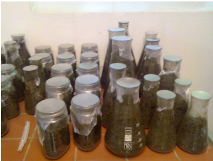
Abb. 3: Gefäße mit dem Substratinokulum, bestehend aus Pilz- und Torfsubstrat

Trieb- und Wurzelbasisstücke der geschädigten Gurkenpflanzen (Abb.2) wurden nach Oberflächendesinfektion auf Befall mit Fusarium spp. untersucht und Isolate daraus gewonnen.