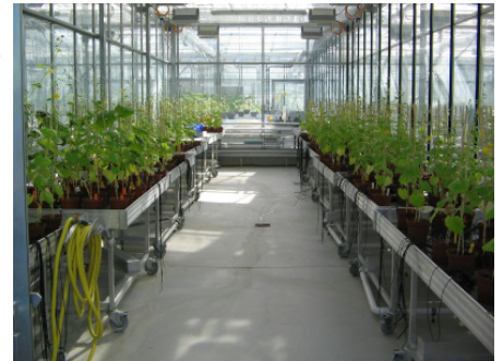
Abb. 4: Gewächshauskabine mit den infizierten Gurkenpflanzen

In nachfolgenden Pathogenitätsuntersuchungen, mittels Pflanzen- und Substratinokulation (Abb.3), wurden neun der gewonnenen Fusarium spp.-Isolate im Gewächshaus (Abb. 4) an insgesamt sieben Gurkensorten ('Aztec', 'Componist', 'Dirigent', 'Karaoke', 'Madita', 'Majestosa', 'Melody') geprüft.