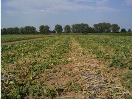
Abb. 1: Nesterweise Absterbeerscheinungen auf einem Gurkenfeld in Niederbayern im Sommer 2007

In Niederbayern, einem traditionellen Anbaugebiet für Freilandeinlegegurken, kam es in den letzten Jahren wiederholt zu nesterweisen Welke- und Absterbeerscheinungen von Gurkenpflanzen auf dem Feld beim Anbau unter Vlies- und Folienabdeckung (Abb.1). Sowohl im August 2007, als auch im Juli 2008 wurden mit Welkesymptomen geschädigte Gurkenpflanzen der Sorten 'Agnes', 'Aztec', 'Fatum', 'Melody' und 'Opalit' von insgesamt acht Standorten entnommen und auf pilzparasitären Befall untersucht.