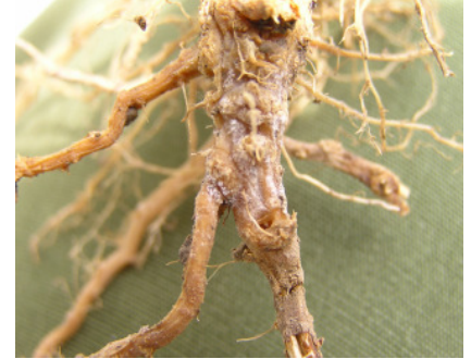
Abb. 2: Wurzeln einer geschädigten Gurkenpflanze

In Niederbayern, einem traditionellen Anbaugebiet für Freilandeinlegegurken, kam es in den letzten Jahren wiederholt zu nesterweisen Welke- und Absterbeerscheinungen von Gurkenpflanzen auf dem Feld beim Anbau unter Vlies- und Folienabdeckung (Abb.1). Sowohl im August 2007, als auch im Juli 2008 wurden mit Welkesymptomen geschädigte Gurkenpflanzen der Sorten 'Agnes', 'Aztec', 'Fatum', 'Melody' und 'Opalit' von insgesamt acht Standorten entnommen und auf pilzparasitären Befall untersucht.