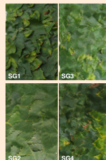
Abb. 4: Blätter einzelner Bäume auf der Messplatte SG1, SG3: CLRV-infizierte Birken SG2, SG4: nicht CLRV-infizierte Birken