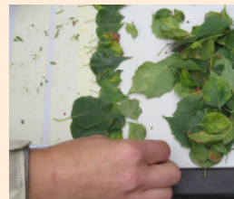
Abb. 2: Probenvorbereitung: Fixierung der Blätter auf einer Platte

A: Absterbeerscheinungen B: Blattrollen und Chlorosen C: Chlorosen und chlorotische Linienmuster