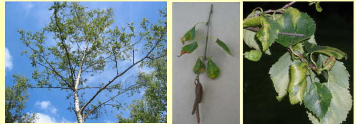
Abb. 1: Cherry leaf roll virus induzierte Symptome an Betula pendula

Das Cherry leaf roll virus (CLRV) ist ein weit verbreiteter viraler Krankheitserreger, der Laub- und Obstgehölze, Stauden und auch einige krautige Pflanzen natürlich infiziert. Zu den betroffenen Gehölzen zählt auch die Gattung Betula . CLRV-infizierte Betula spp. entwickeln Blattsymptome wie chlorotische Ringflecken, Blattrollen und weisen einen deutlichen Vitalitätsverlust auf, der meist mit Absterbeerscheinungen einhergeht (Abb. 1).