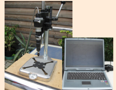
Abb. 3: Datenerfassung mit Hilfe eines UV/VIS/NIR-Spektrometers